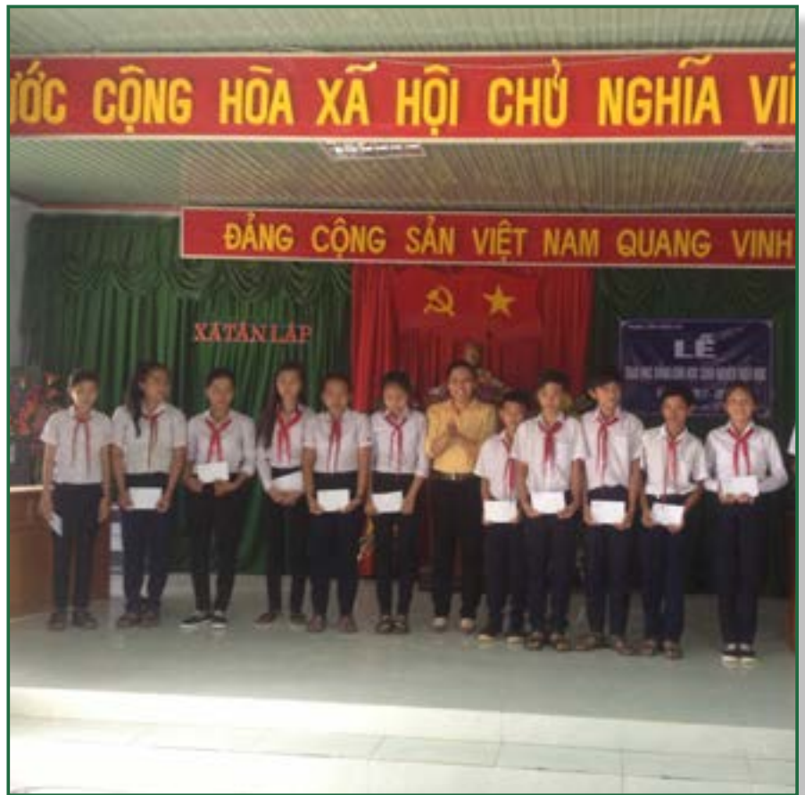
Remise des bourses scolaires

CHAQUE ANNÉE, AVEC LES ÉCOLES NOUS ORGANISONS LA MARCHÉ DE LA SOLIDARITÉ. LA MOBILISATION EST ÉNORME, CAR L'OBJECTIF A ÉTÉ CHOISI AVEC LES VILLAGEOIS ET LES AUTORITÉS : POUR QUE TOUS LES ENFANTS PUISSENT ALLER À L'ÉCOLE, DES BOURSES SCOLAIRES.