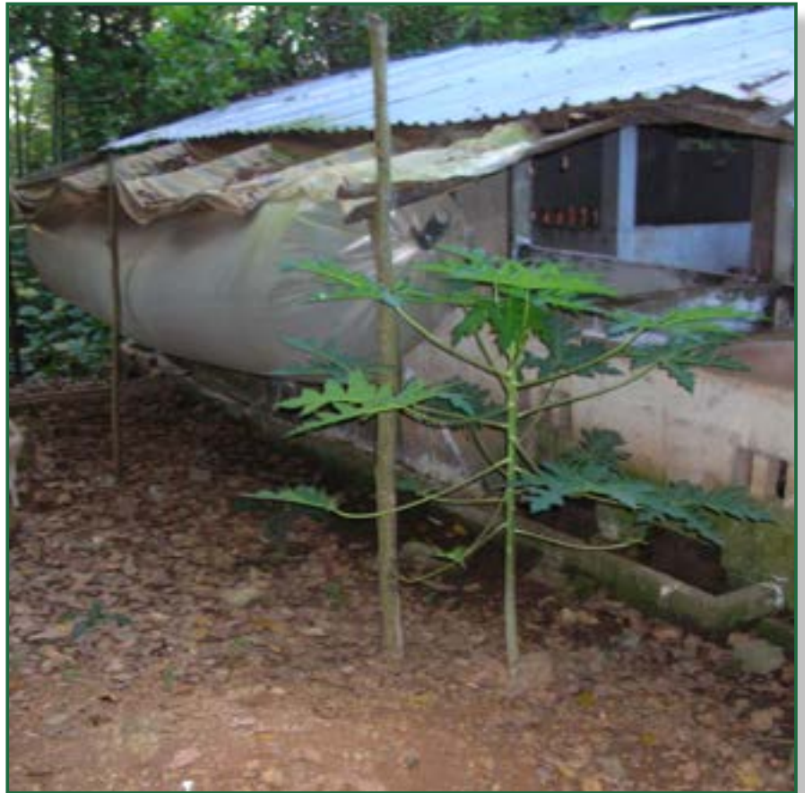
Installation de biogaz